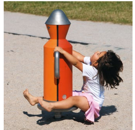
Best.-Nr. 6.28100 Drehmännchen mit Armen, rot / orange