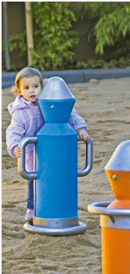
Best.-Nr. 6.28100 Drehmännchen mit Armen, hellblau / blau