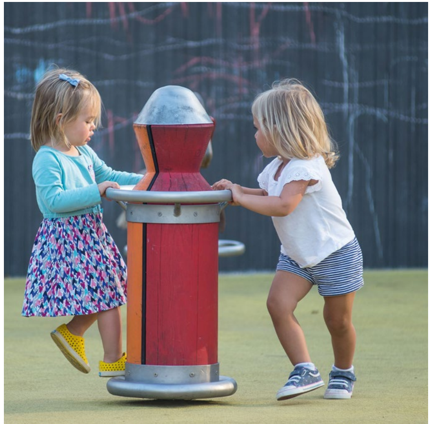
Best.-Nr. 6.28104 Drehmännchen mit Kragen, rot / orange, Foto © Daniel Perales