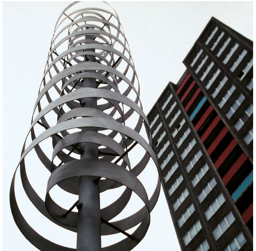
Doppelhelix graubner Spielstationen zur Entfaltung der Sinne