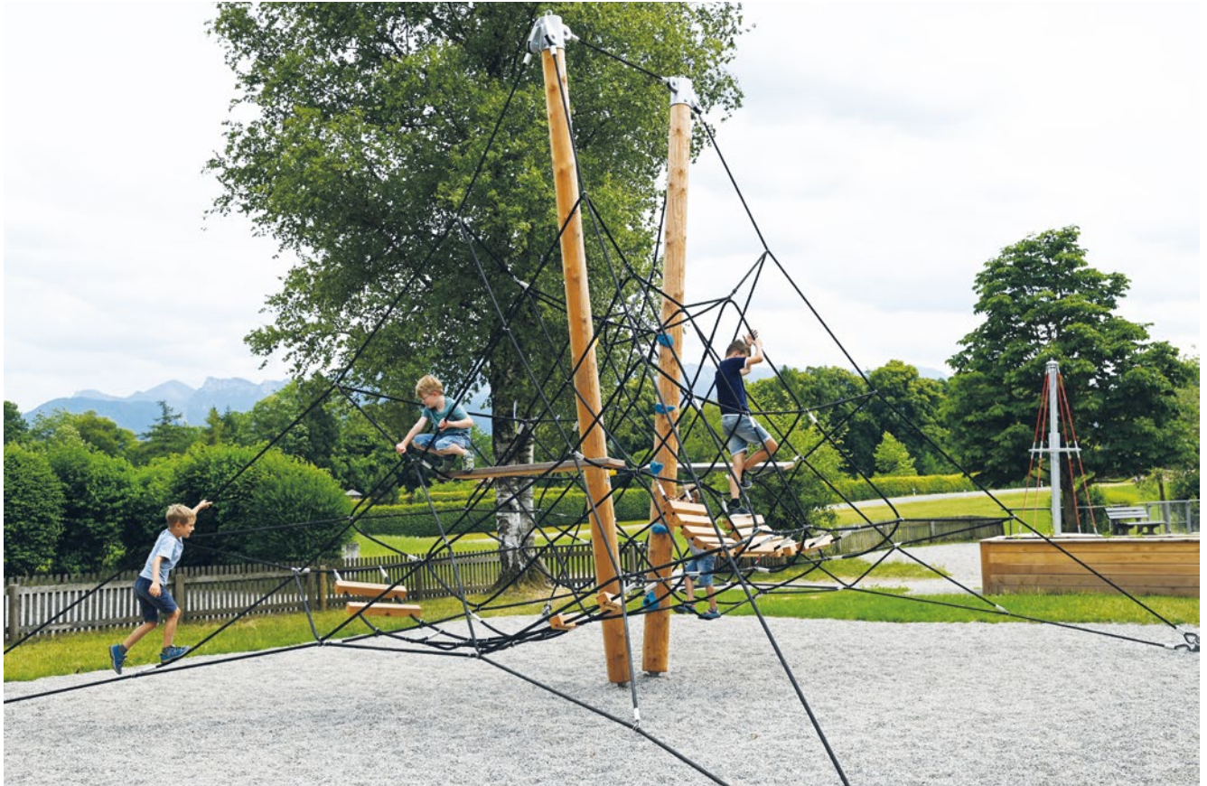
Best.-Nr. 13.02000 Mittlere Netzpyramide. Das Foto zeigt das Grundgerät inkl. aller optional verfügbaren Einbauelemente.

Die Netzpyramide kann erklettert, erklommen und erforscht werden, dient dabei aber nicht nur zum Erleben von Höhe und für taktile Erfahrungen an Händen und Füßen, sondern schafft u.a. mit den optionalen Hängesitzen auch attraktive Sitzgelegenheiten zum Ausruhen, Beobachten und Unterhalten. Verschiedene Ebenen und Pfade, die zu unterschiedlichsten Bewegungs- und Rollenspielen auffordern, fördern zudem die Konzentration und Geschicklichkeit.