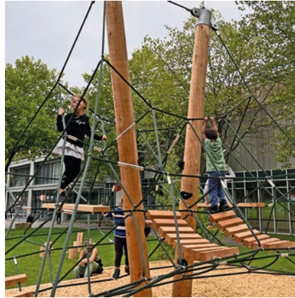
Best.-Nr. 13.01000 Kleine Netzpyramide

„Die beste Vorbereitung auf Mathe, ist nicht Mathe üben, sondern auf Bäume klettern“, so der renommierte Neurobiologe Gerald Hüther. Denn: beim Klettern werden beide Gehirnhälften verknüpft sowie motorische, kognitive und soziale Kompetenzen gefördert. Außerdem lernen Kinder spielerisch, Verantwortung zu übernehmen. Bei der Netzpyramide erleben wir eben diese Phänomene. Zudem erweckt sie durch ihre Erscheinung schon von weitem Aufmerksamkeit. Mit der dreidimensionalen Netzstruktur stellt sie die Kinder vor vielfältige Herausforderungen und regt ihre Kreativität an.