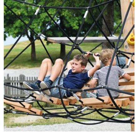
Best.-Nr. 13.01001 Optionales Einbauelement