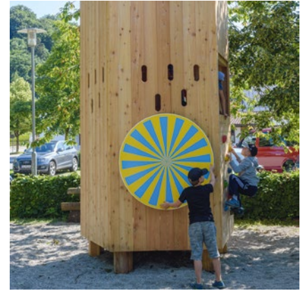
Sonderausführung mit rotierender Scheibe 10.22100ff.