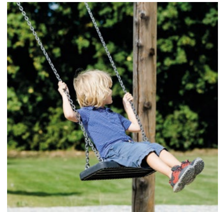
Best.-Nr. 6.12820 Doppelte Wiesenschaukel spezial