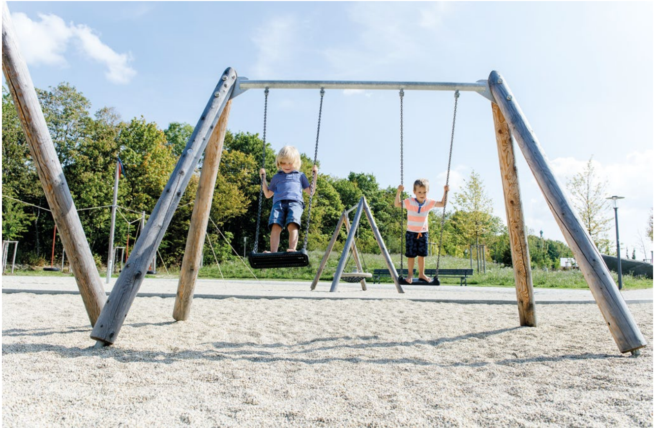
Verschraubung Querbaum technisch geändert