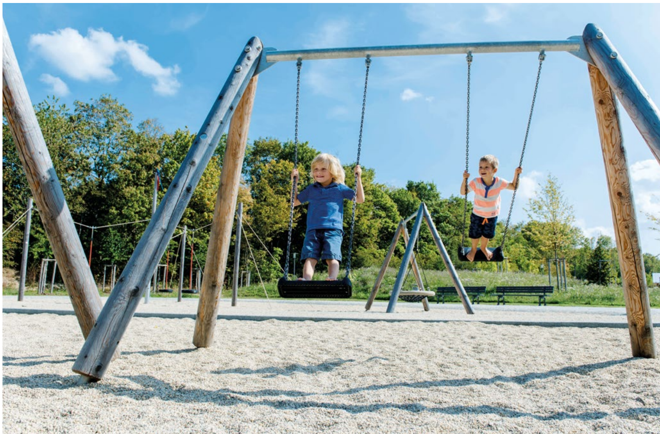
Best.-Nr. 6.14020 Hohe Zweifachschaukel spezial