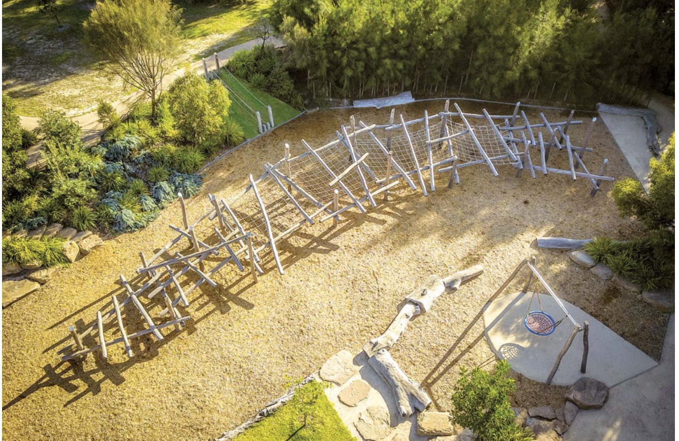
Sonderausführung mit Ringen und Kappen