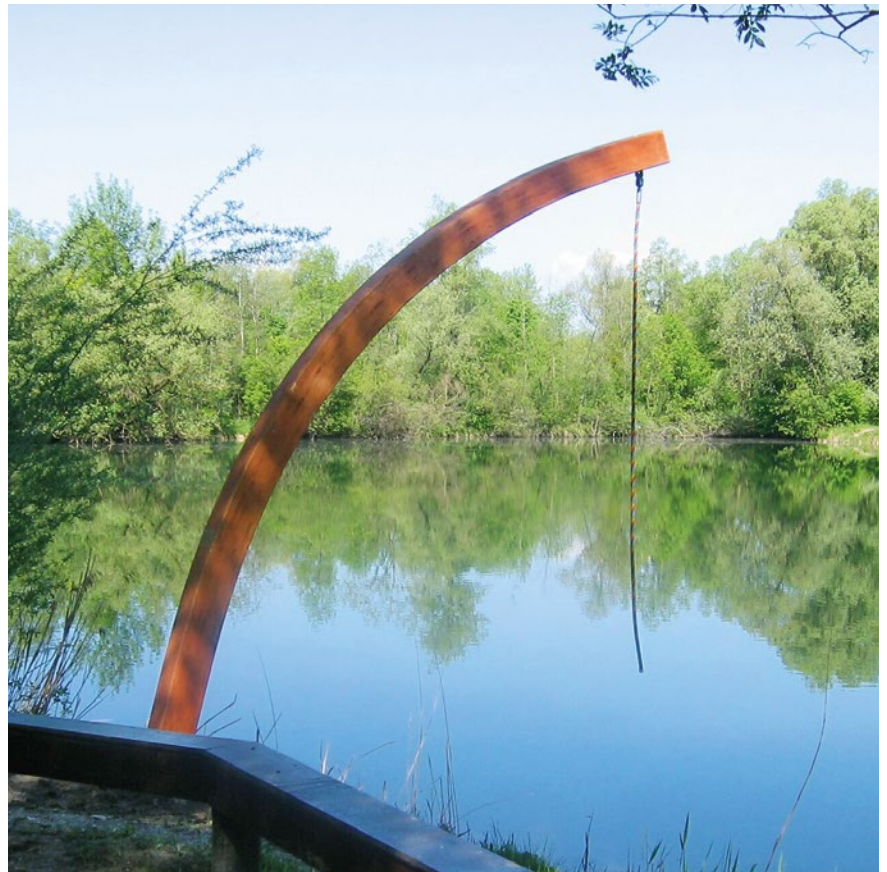
Best.-Nr. 7.64200 Tarzantau