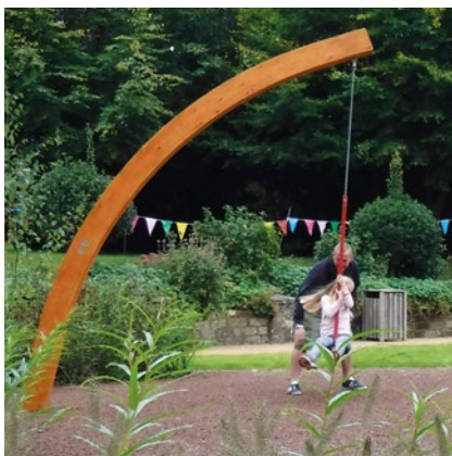
Best.-Nr. 7.64300 Tarzantau mit Pendelsitz