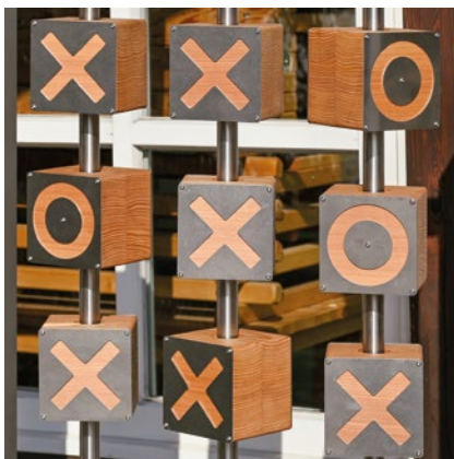
Tic Tac Toe