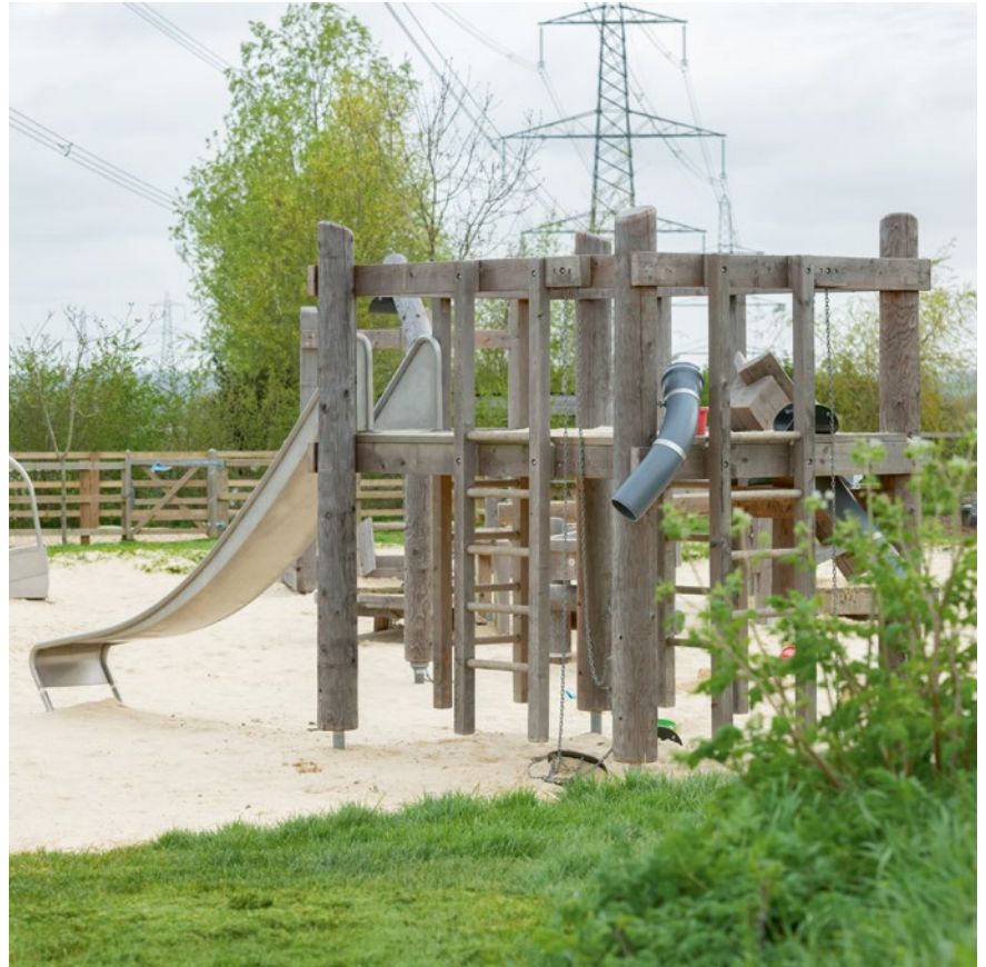
Best.-Nr. L5.01410 Bauwerkgerüst 014