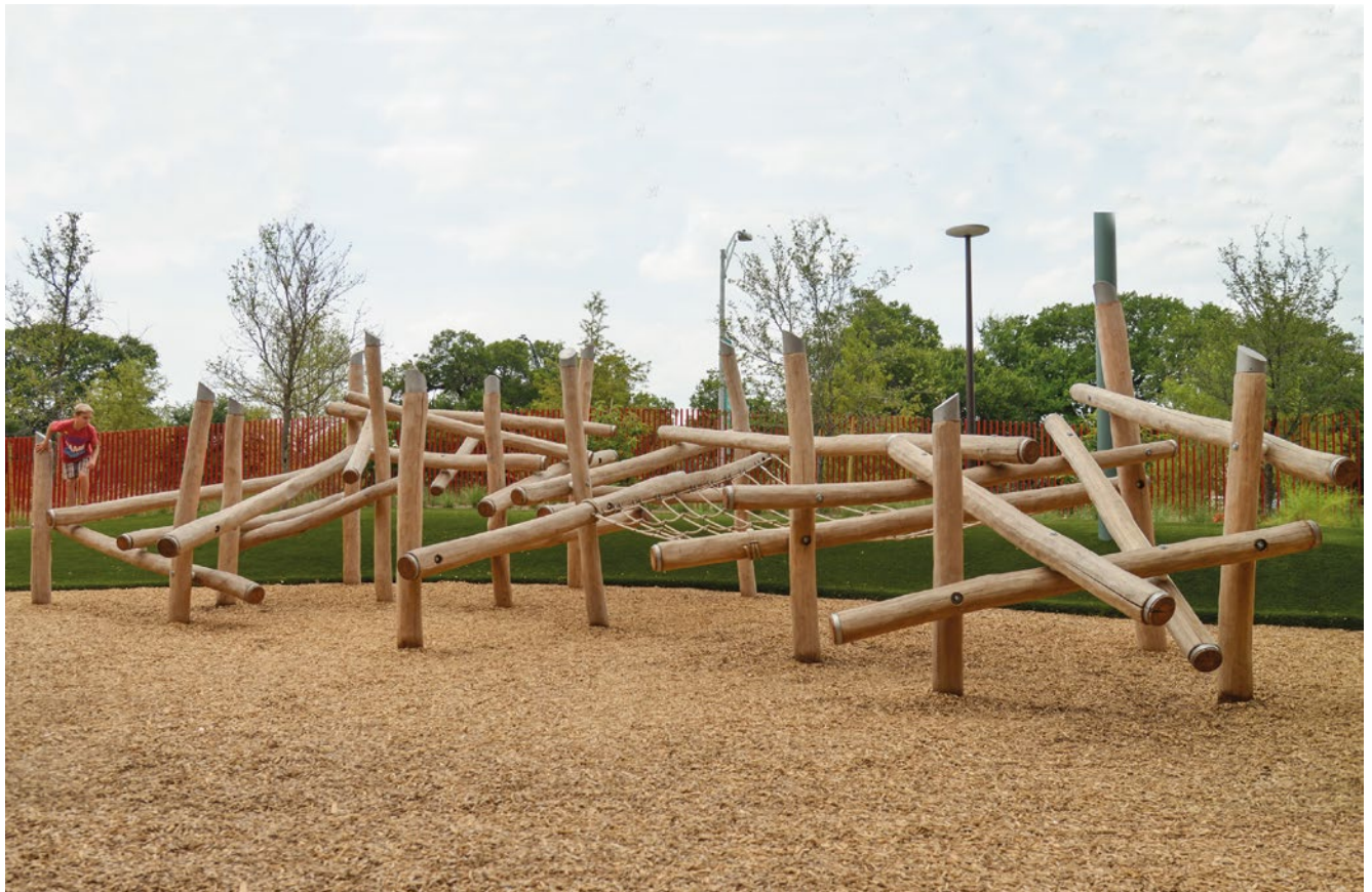
Sonderausführung mit Ringen und Kappen