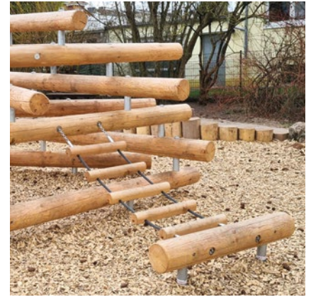
Sonderausführung mit angebauter Hängebrücke

Der Stapel bietet nicht nur Raum zum Klettern, zum Erleben von Höhe, und für sinnliche Erfahrungen an Händen und Füßen, sondern dient auch als attraktiver Sitzplatz zum Ausruhen, Unterhalten und Beobachten.