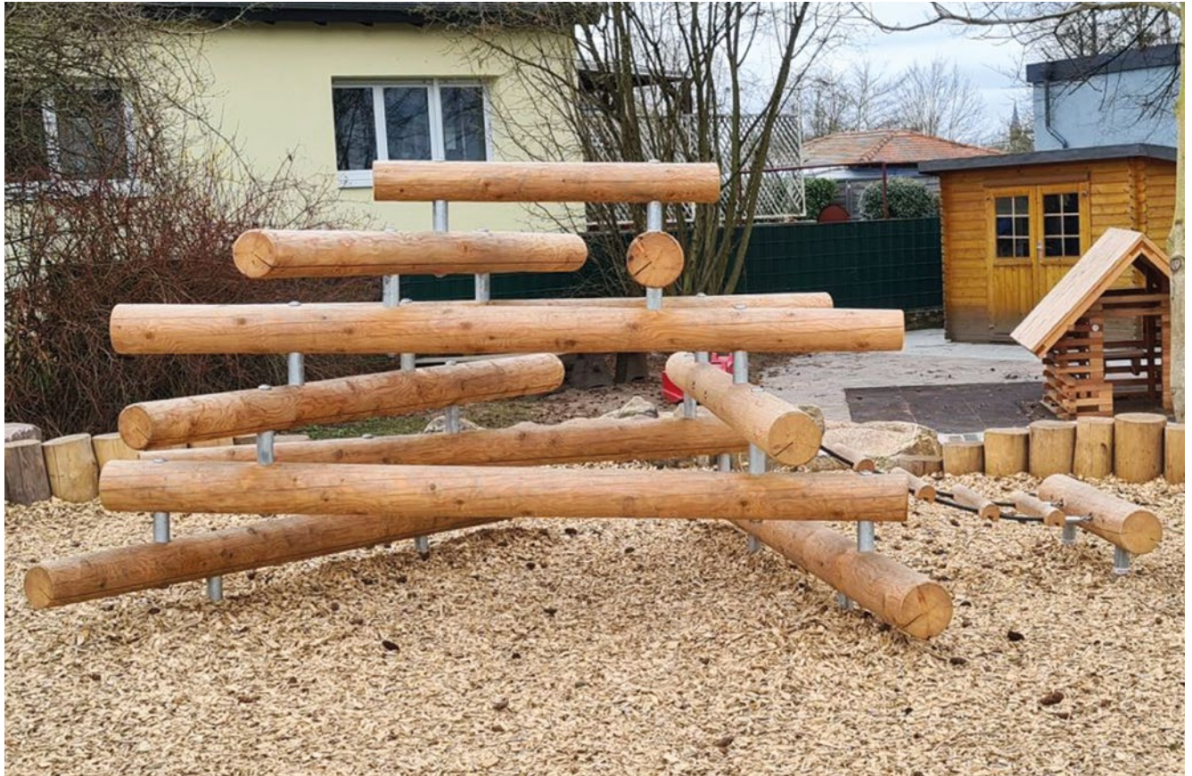
Sonderausführung mit angebauter Hängebrücke